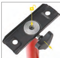
Schnellverschluss zur Aufnahme des Doppelträgers