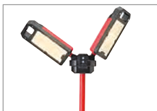
Warmes Licht (4000 K).