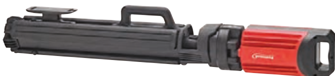
Kompakt zusammengelegt für den Transport, mit praktischen Tragegriffen.