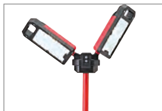
Kaltes Licht (7000 K).