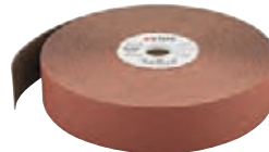
8151 + 8154 VSM