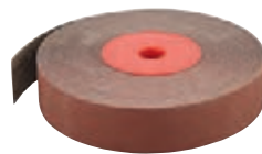
8150 + 8153 format professional quality