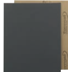
8141 format professional quality