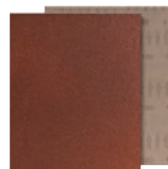
format professional quality

Hinweis: Handschleifklötze aus Kork siehe Bestell-Nr. 8165 0002, Schmirgelfeile siehe Bestell-Nr. 8166 0010 8/24.