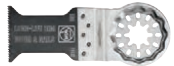
Form 160 STARLOCK