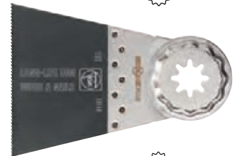
Form 161 STARLOCK PLUS