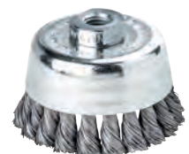
7988 LESSMANN® THE GERMAN BRUSH COMPANY