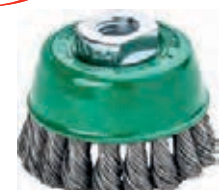
7989 + 7990 LESSMANN® THE GERMAN BRUSH COMPANY