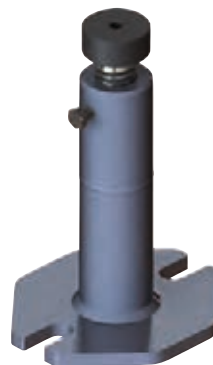
3929 format professional quality