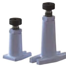
3929 format professional quality