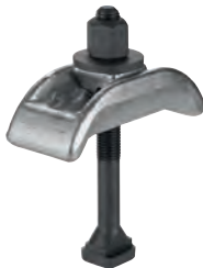
3/158 Spannpratze, kurz