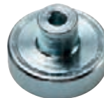
3/211 Samarium-Magnet-Flachgreifer mit Gewindebuchse