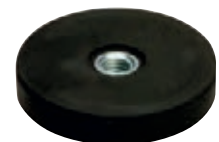
3/213 Neodym-Magnet-Flachgreifer mit Neopren-Schutzmantel