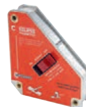
3/218 Schweißhilfe, schaltbar