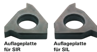
Auflageplatte für SIR

Δ Abgabe nur als ganze Verpackungseinheit möglich. Hinweis: Weitere Auflageplatten mit anderen Steigungswinkeln auf Anfrage.