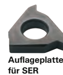
Auflageplatte für SER