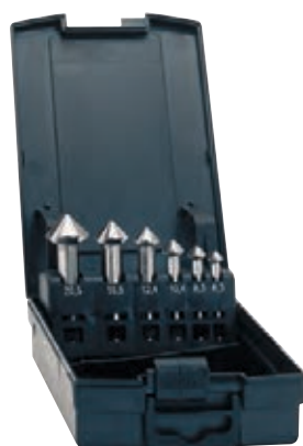
1440 + 1439 blank