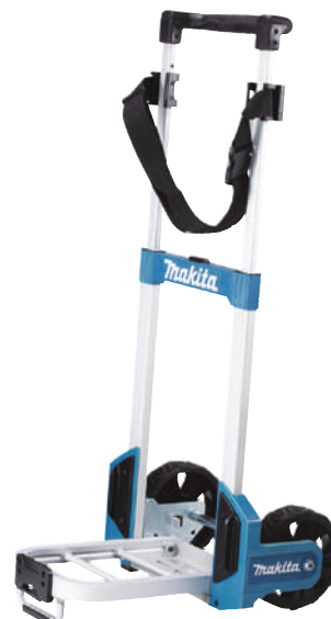
Abbildung mit Zubehör