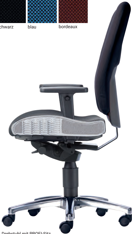
Drehstuhl mit PROFİ-Sitz (7-Zonen Boxspring-Federkern, weich) optionalem Alu-Fußkreuz, höhen- und breitenverstellbaren 2D-Armlehnen.