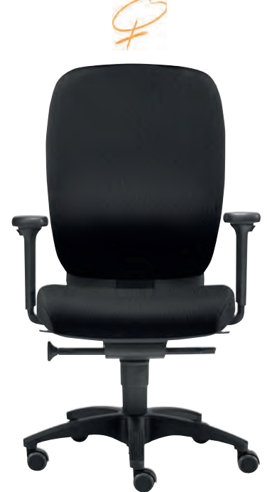
Drehstuhl – PROFİ OFFICE mit Frauen-Sitz, optionalem Alu-Fußkreuz, höhen- und breitenverstellbaren Armlehnen.