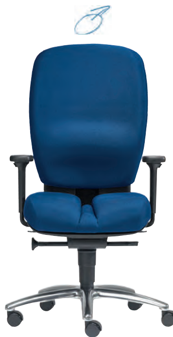
Drehstuhl – PROFİ OFFICE mit Männer-Sitz, optionalem Alu-Fußkreuz, höhen- und breitenverstellbaren Armlehnen.

Sitzbreite: 490 mm. Sitztiefe: 460–520 mm. Sitzhöhe: 440–570 mm. Lehnenhöhe: 600-680 mm, 5-fach verstellbar.