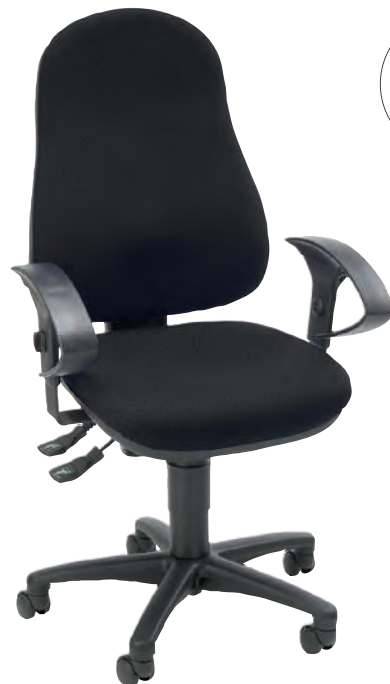
Abb. zeigt Bürodrehstuhl mit Armlehnen Typ U2 (Zubehör).