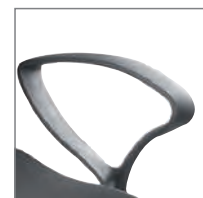
Armlehne Typ SU.