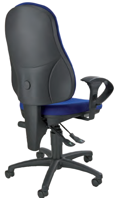
Abb. zeigt Bürodrehstuhl mit Armlehnen Typ U2 (Zubehör).