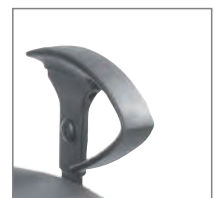
Armlehne Typ U2, höhenverstellbar.