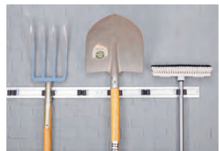
5 Lieferung ohne Geräte.