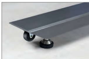
Bequemer Transport mit Rollen