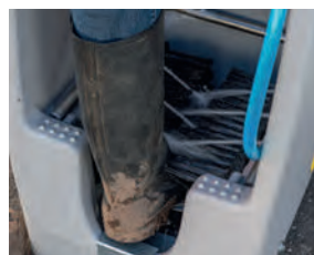
Sammelwanne für Schmutzwasser.