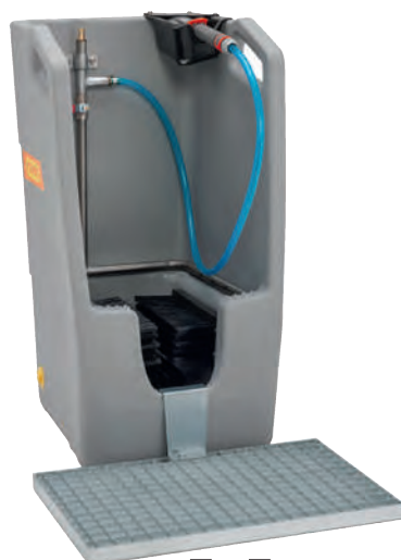
1 mit 2 Abstreifrost.