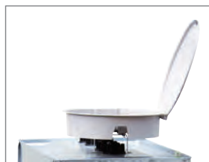
1 nur für MULTI-Tank