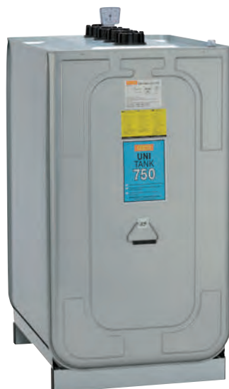
UNI-Tank 750 I.