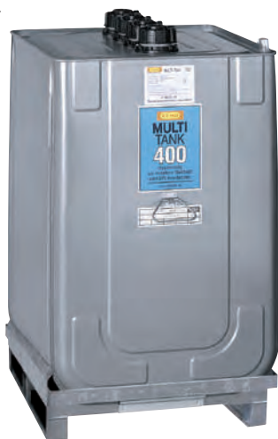
MULTI-Tank 400 I mit Stahlblechpalette.