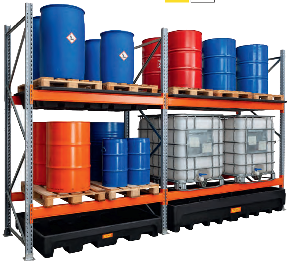
Anwendungsbeispiel mit PE-Einhängewannen und PE-Bodenwannen.