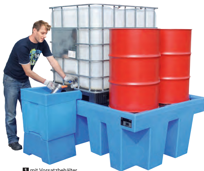
1 mit Vorsatzbehälter.