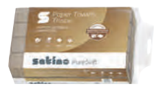
5/79 Handtuchpapier SATINO