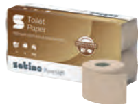
5/79 Toilettenpapier SATINO