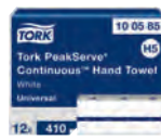
5/78 Handtuchpapier TORK®