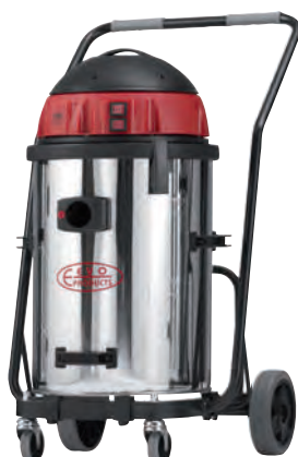
2 Typ 429 K