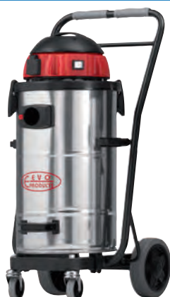
1 Typ 503 K