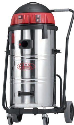
3 Typ 440 K