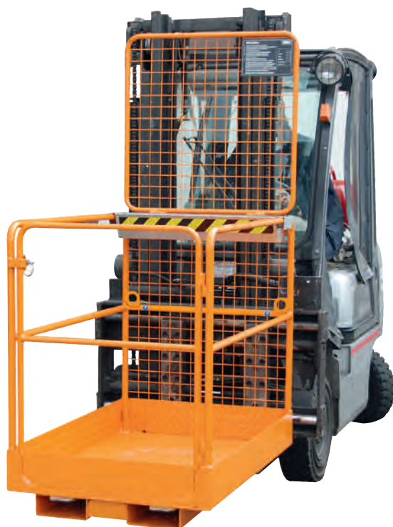
4 Aufnahme an der Schmalseite, selbstverriegelnde Tür