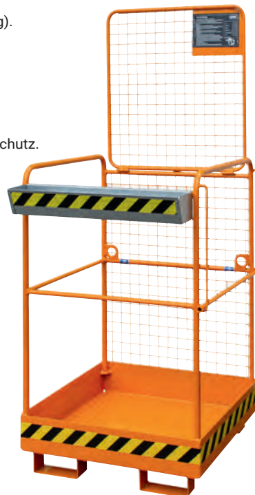
1 Aufnahme an der Schmalseite, Sicherungsstange