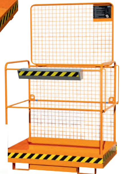
2 Aufnahme an der Breitseite, Sicherungsstange