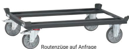
Routenzüge auf Anfrage