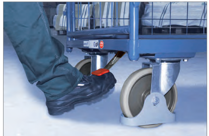
... und zu lösen.