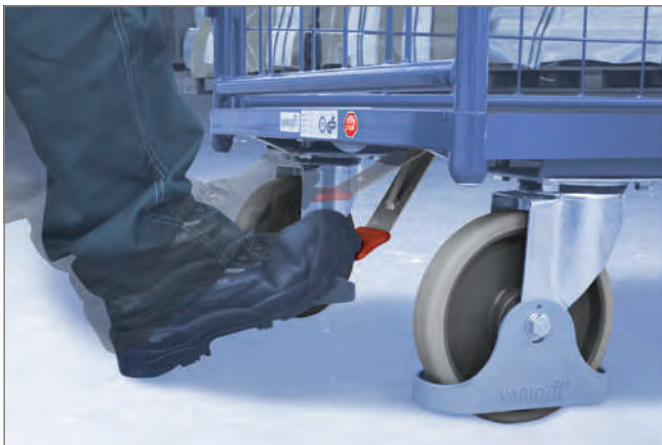
Einfach per Fuß zu betätigen ...