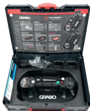
Typ Nemo Grabo Plus im Systainer