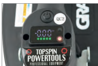
Digitalanzeige mit aktueller Hebekraft