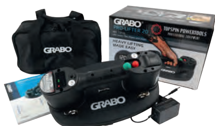
Typ Nemo Grabo Pro in Nylontasche