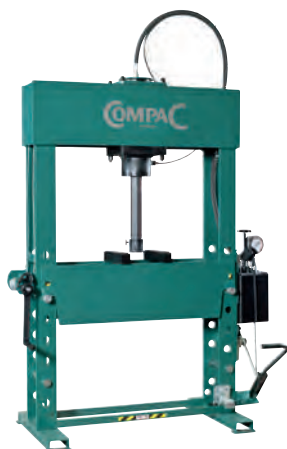
Modell FP 50 mit Fußbedienung.