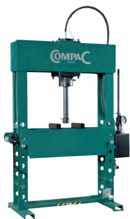
Modell HP50 mit Handbedienung.