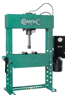
Modell EP60 mit einfach wirkendem Zylinder.

Hinweis: Das Stromanschlusskabel ist nicht im Lieferumfang enthalten.