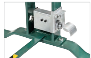
Fußbedienter pneumatischer Schnellhub (Modellreihe FP/HP 20-25).