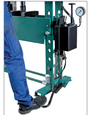
Freie Hände durch Fußbedienung (Modellreihe FP20-25).