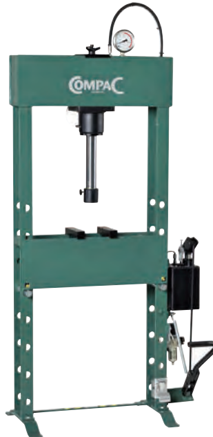
Modell FP25 mit Fußbedienung.