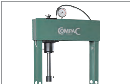
Seitwärts verschiebbarer Presszylinder.

Extra langer Hub bis 240 mm (Maß D) Fußbedienter, pneumatischer Schnellhub. Luftanschluss mit Wasserabscheider montiert. Pneumatischer Kolbenrücklauf, Ablassfunktion in der Fußbedienung integriert (FP 20/25). Pneumatischer Kolbenrücklauf, Ablassfunktion im Griff integriert (HP 20/25).