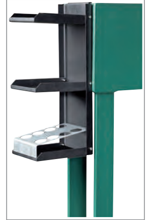
Ablageplatten (ohne das abgebildete Zubehör)