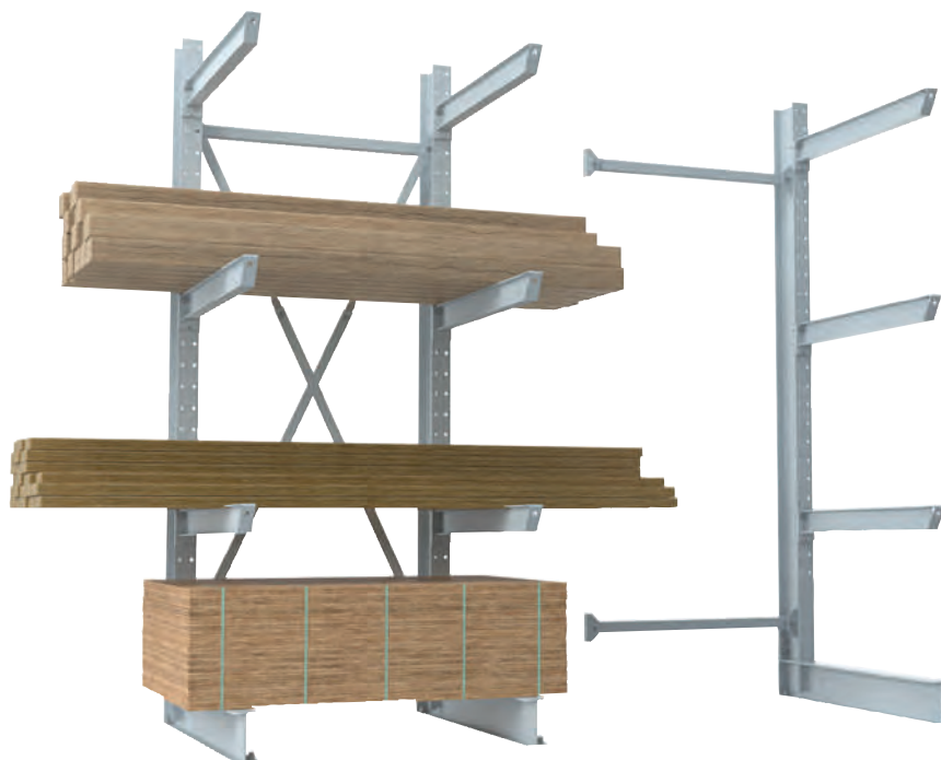
Grund-/Anbauregal einseitig, feuerverzinkt

Für jede Lagerungsaufgabe bieten wir die passende Regalhöhe, Regallänge und Belastbarkeit. Auch in anderen RAL-Farben lieferbar. Auf Wunsch auch mit Kragarmen zum Einhängen. Regale erweiterbar durch vielfältiges Zubehör (Gitterroste, Armbrücken, uvm.). Höhere Lasten im Innen- und Außenbereich möglich. Fragen Sie uns hierzu an!