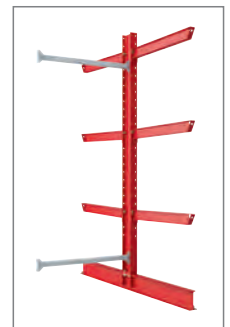
Anbaufeld, RAL 3000