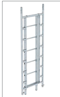
Flexx Tower Treppenkit 2