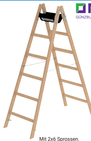
Mit 2x6 Sprossen.