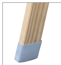
Außenschuh auf Anfrage lieferbar.

Hinweis: Für diese Produkte gilt die gesetzliche Gewährleistung.