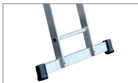
Ab 3,00 m Leiterlänge mit Traverse.