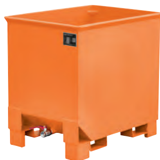
Typ CS 30, RAL 2000

Hinweis: Auch mit Gabelhubwagen transportierbar.