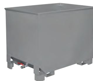
Typ CS 80, RAL 7005