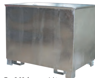
Typ C 80, feuerverzinkt