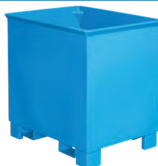
Typ C 30, RAL 5012

Hinweis: Auch mit Gabelhubwagen transportierbar.