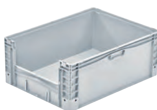
Entnahmeöffnung an der Stirnseite.