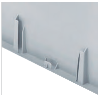
Integrierter Etikettenhalter jeweils an einer Stirn- und Längsseite.