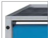
Schubladenschrank mit Antirutschmatte.