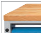
Thekenschränk mit ANKE Buche-Massiv-Platte.