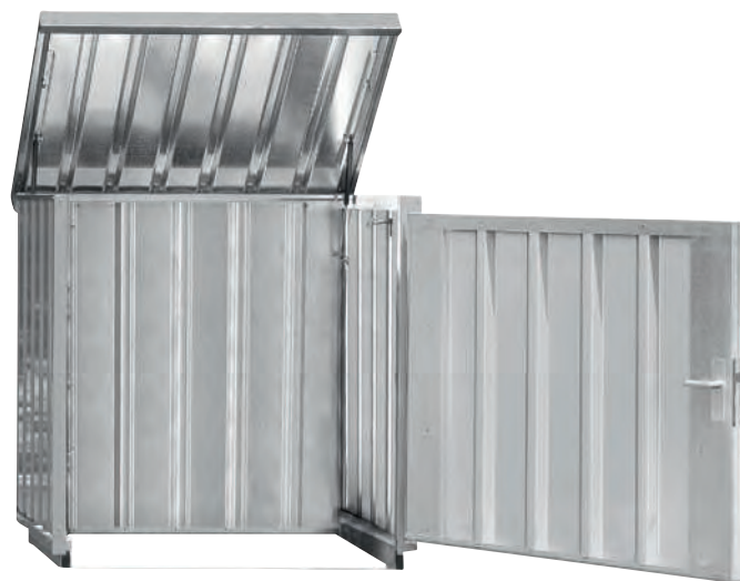
Magazinbox Typ 1 ohne Boden, mit Außenlackierung. Geeignet z. B. für die Unterstellung von Rest- und Wertstofftonnen.