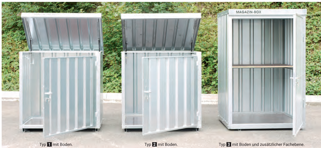
Typ 1 mit Boden.