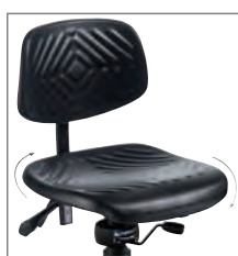
9 mybttec 360°-Sitzgelenk.