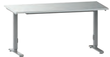
Arbeitstisch SOLO Basic