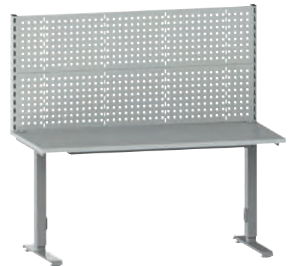
Arbeitstisch SOLO WORKS inkl. Aufbau

Im Bereich von Montage und Labor. Tragkraft: 200 (kg/Fuß) und bis 400 (kg/pro Arbeitstisch).