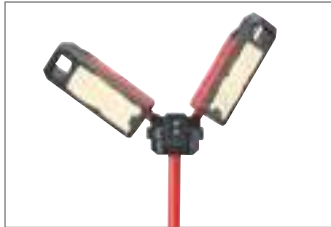
Warmes Licht (4000 K).