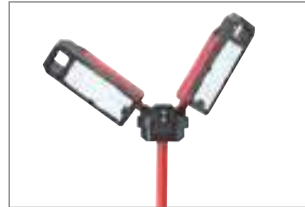
Kaltes Licht (7000 K).