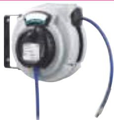
9/92 Automatischer Schlauchaufroller