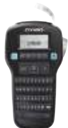
9/121 Beschriftungsgerät LM 160