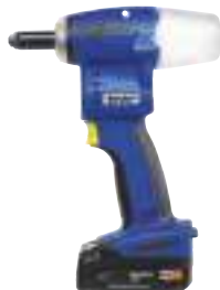
9/64 Akku-Nietgerät AccuBirdie®