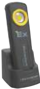
9/15 Akku-LED-Arbeitsleuchte UNI EX