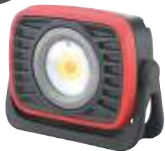
9/30 Akku-LED-Arbeitsleuchte Mini