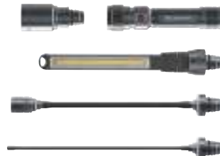
9/21 Akku-LED-Lampensystem Workers Friend