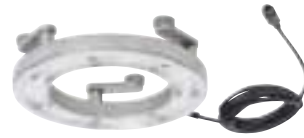
9/40 LED-Maschinenleuchte Kreislicht