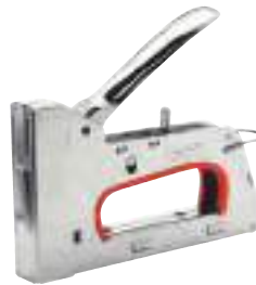
9/78 Handtacker R353