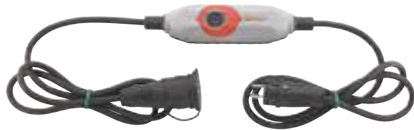
9/10 Personenschutzleiter PRCD-S+