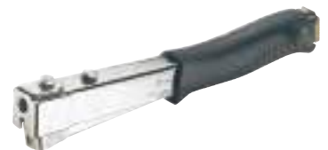
9/78 Hammertacker R11