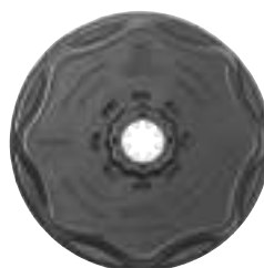
0127 2520 STARLOCK PLUS