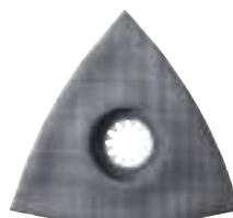
0127 2545 STARLOCK