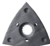
0127 0992 STARLOCK