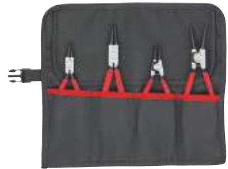
5606 0020 KNIPEX