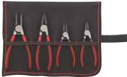
5616 0010 format professional quality

5606 Geschmiedet. Abrutschhemmend durch besondere Spitzengeometrie. Lieferung in Nylon-Rolltasche.