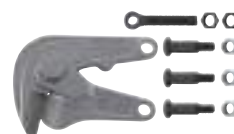
5677 format professional quality