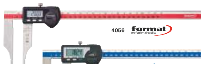
4056 format professional quality