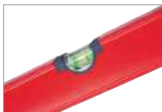
Abgerundetes Libellengehäuse zum sicheren Ablesen.