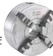
3018 format professional quality