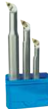
Abb.: Rechtsausführung Lieferung ohne Wendeschneidplatten.