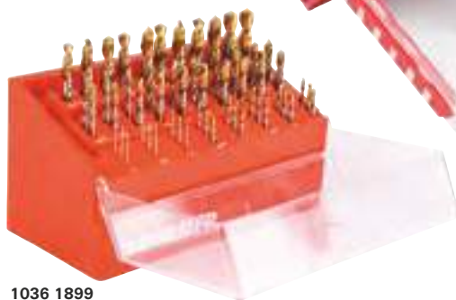
1036 1899 TiN