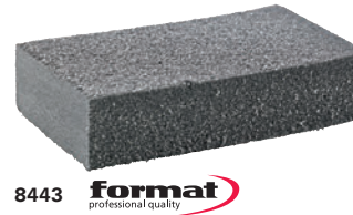
8443 format professional quality

8443 Kunststoffgebundene Silicium-Carbidstreuung (SiC), weich.