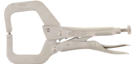
5644 IRWIN VISE-GRIP