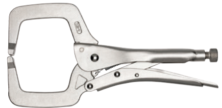
5648 format professional quality