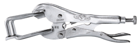
5641 IRWIN VISE-GRIP