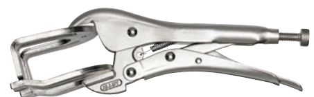
5642 format professional quality