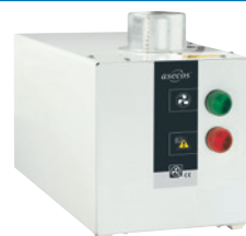
Abb. mit optionalem Entlüftungsaufsatz.

Technische Informationen zu Entlüftungsaufsätzen finden Sie auf der 4/93.